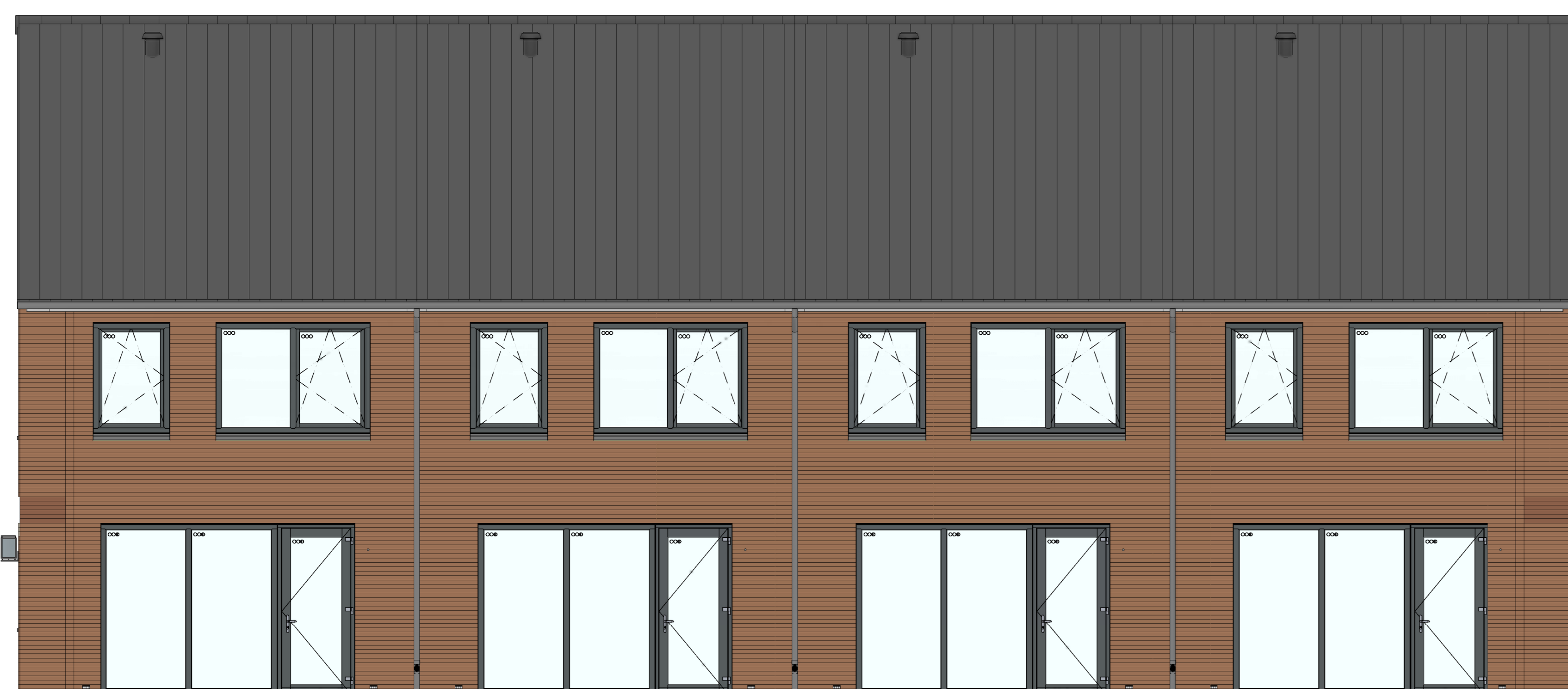
achtergevel 1 : 50