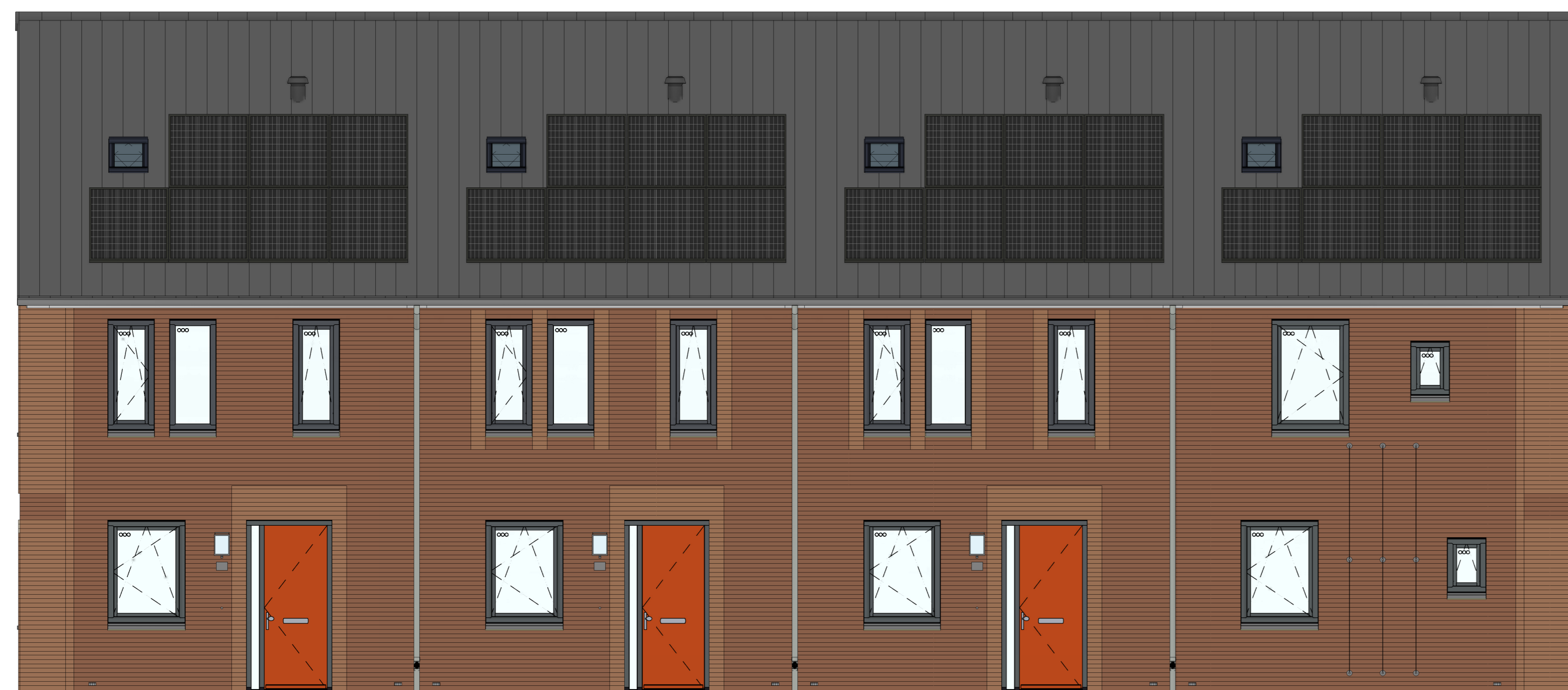
voorgevel 1 : 50