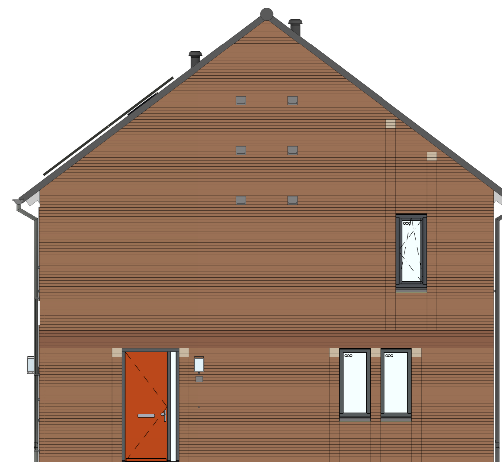
rechterzijgevel 1 : 50