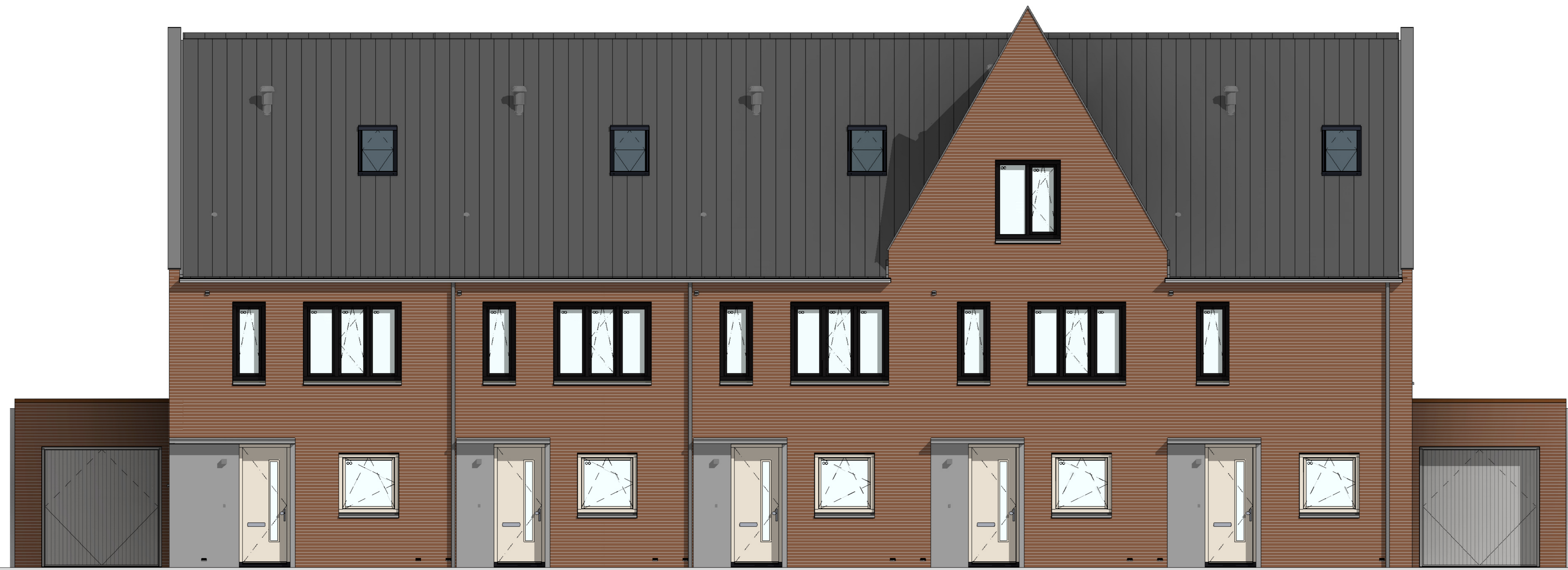
voorgevel 1 : 50