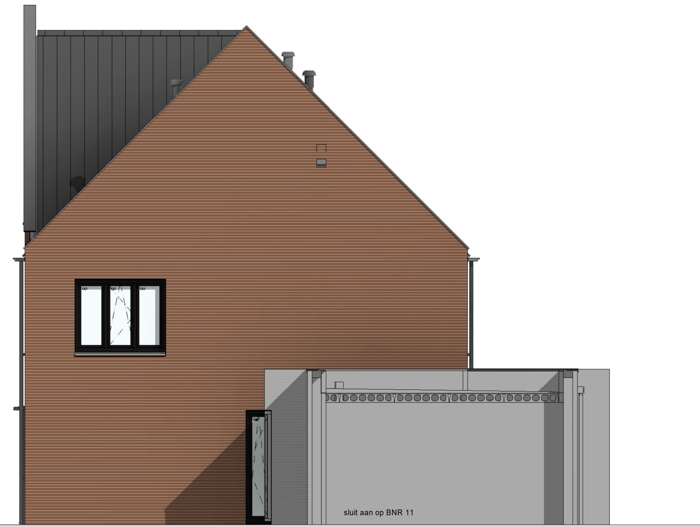
rechterzijgevel 1 : 50