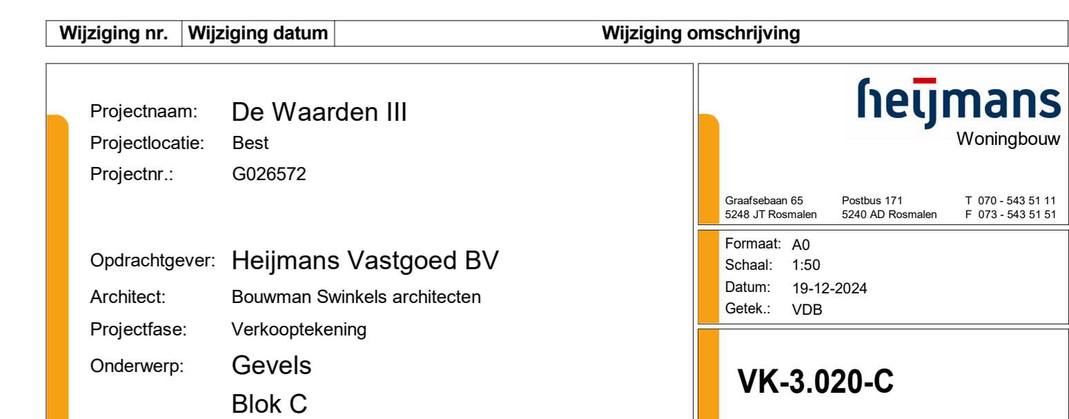
linkerzijgevel 1 : 50