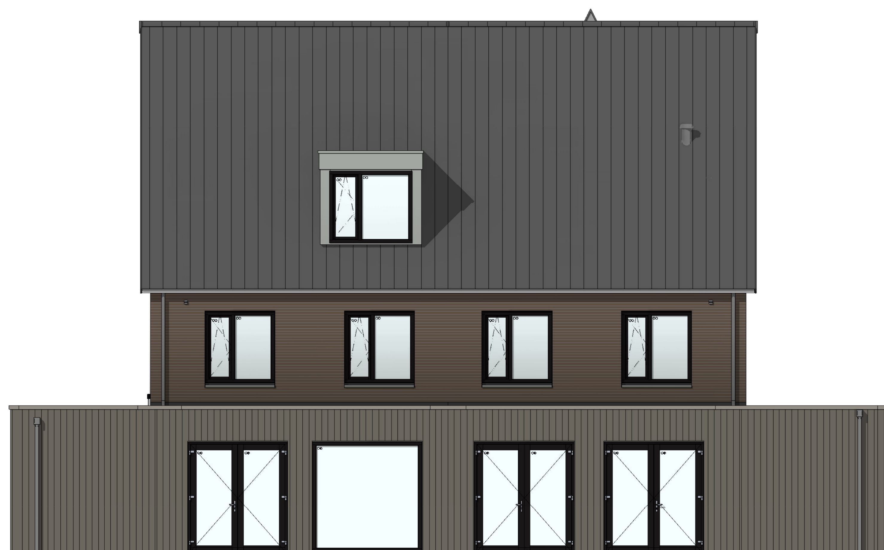
achtergevel 1 : 50