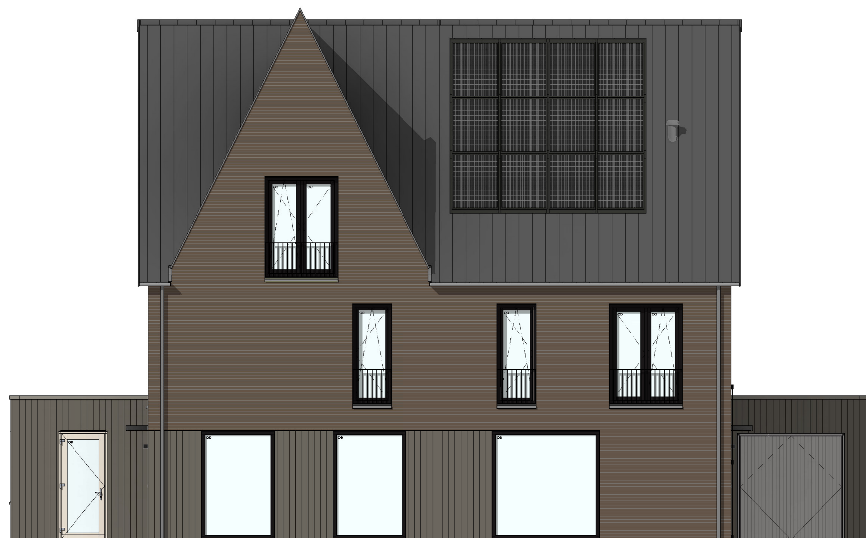
voorgevel 1 : 50