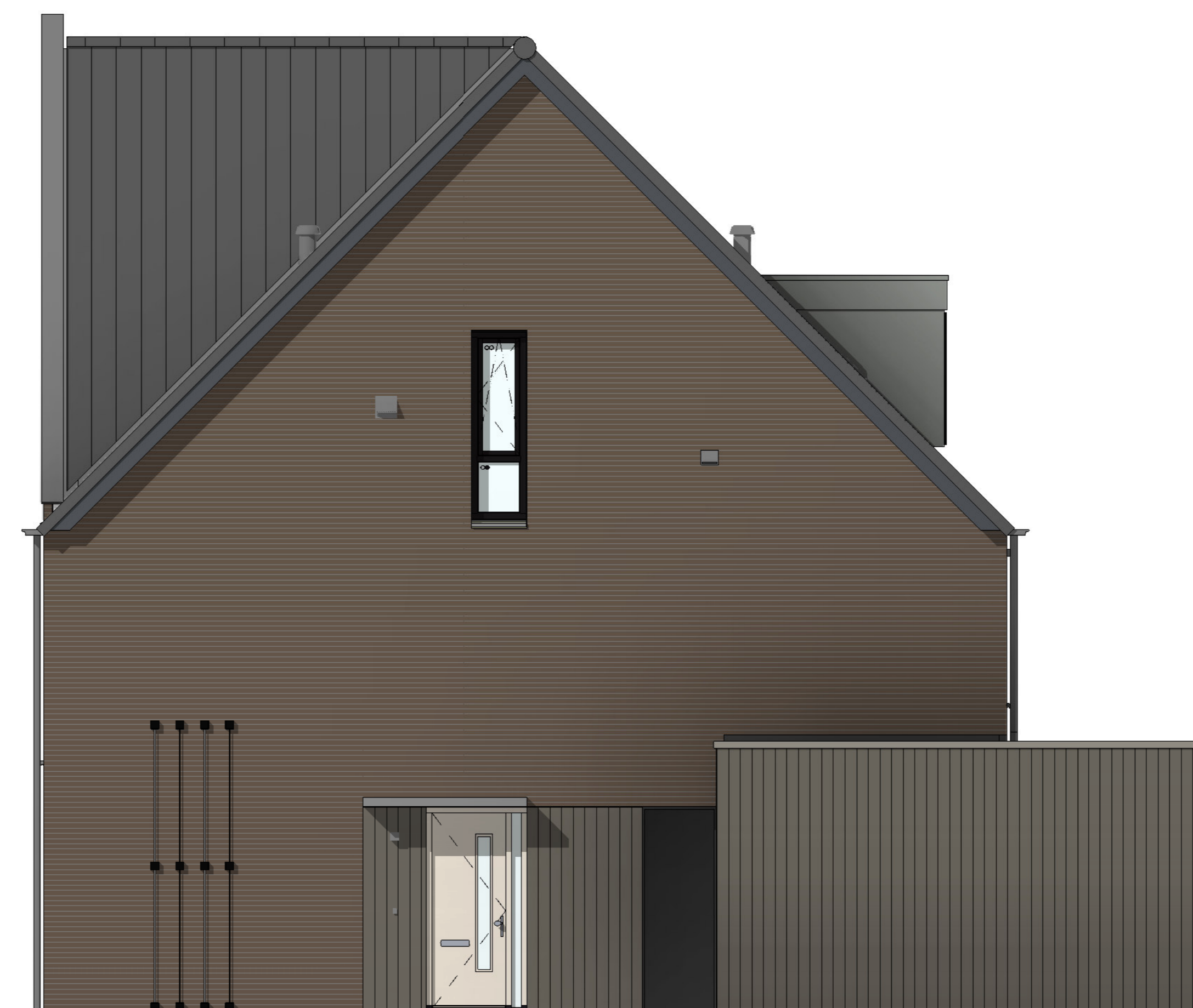
rechterzijgevel 1 : 50