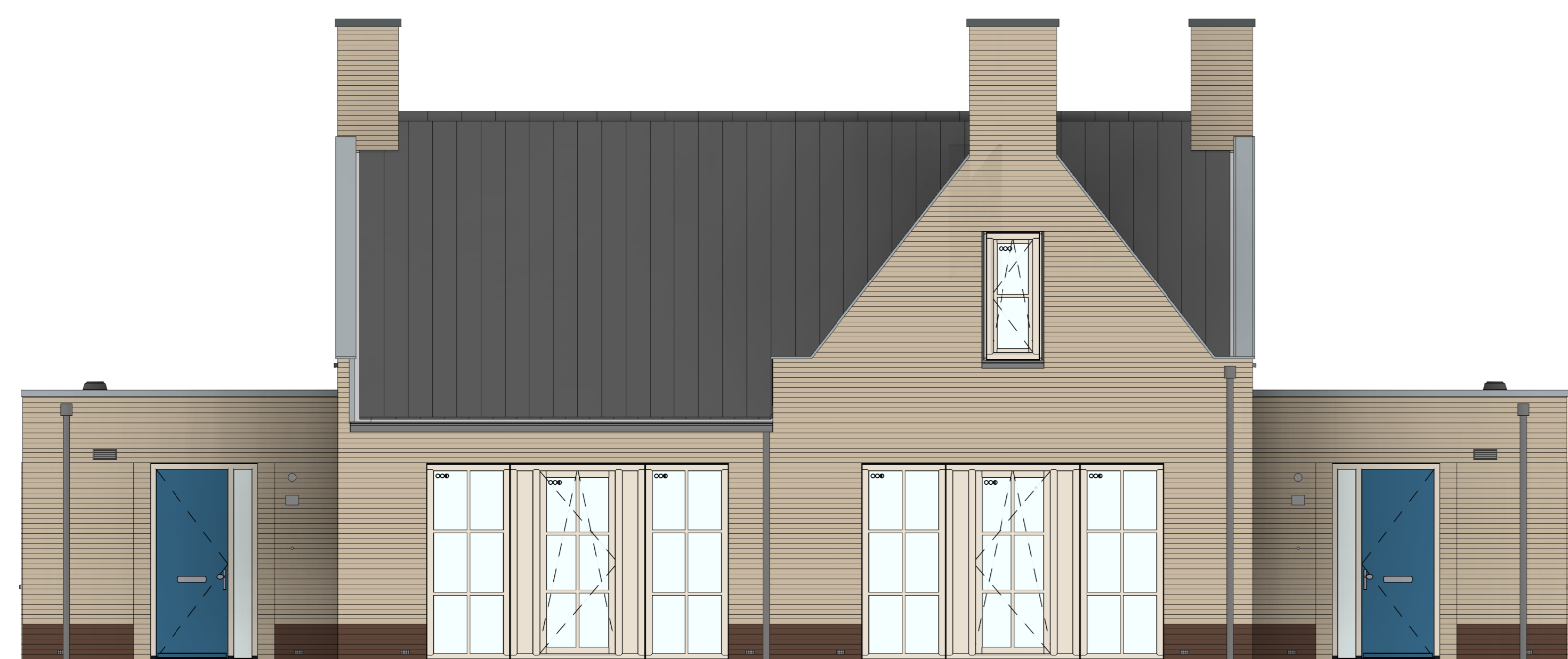
bouwnr. 9 woningtype A2 bouwnr. 10 woningtype A1