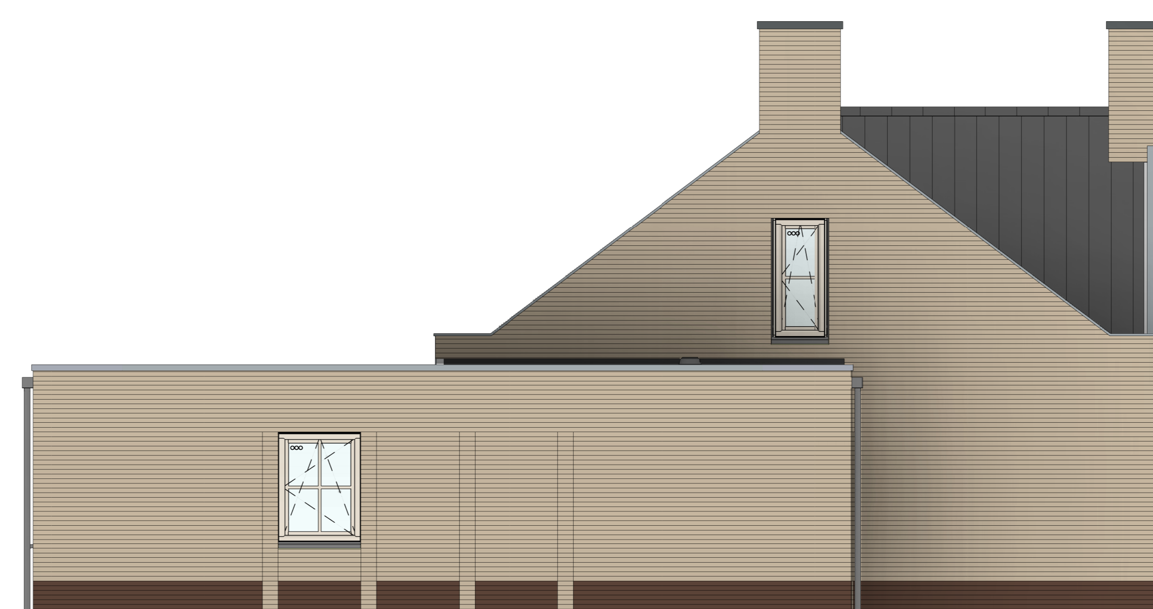
bouwnr. 9 woningtype A2