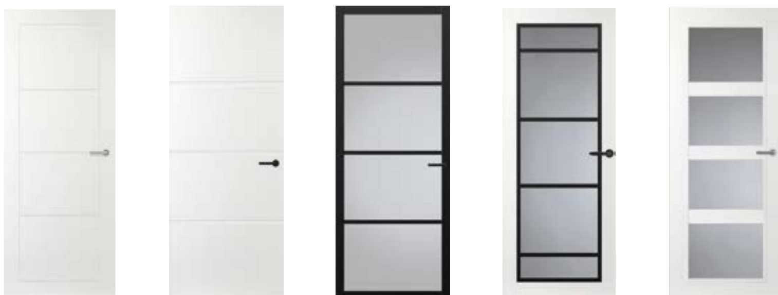
Sfeerbeeld ter impressie

Let op: de woningen worden standaard uitgevoerd met een set Svedex binnendeuren conform technische omschrijving. Wil je andere binnendeuren, kozijnen en krukken dan geldt er een meerprijs. Voor meer informatie verwijzen wij graag naar de Svedex brochure in MijnHeijmans.